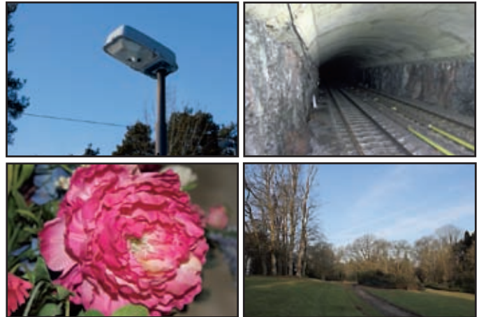
FOTOEKSEMPLER: Noen testbilder tatt med Canon EOS 550D.

7D på sin side er høyst kapabel til å produsere forholdsvis gode bilder på ISO 12800, mens på 550D er resultatene litt mer ujevne. 550D har rett og slett ikke like pene korn